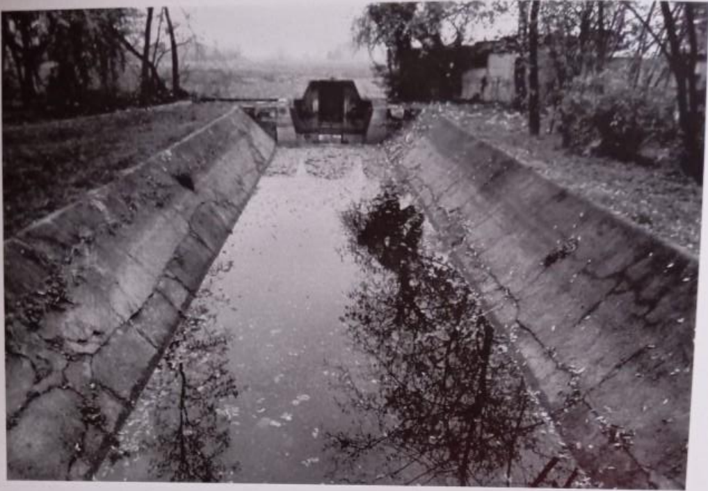
Sopra e sotto: Busto Garolfo, diramazione canale secondario