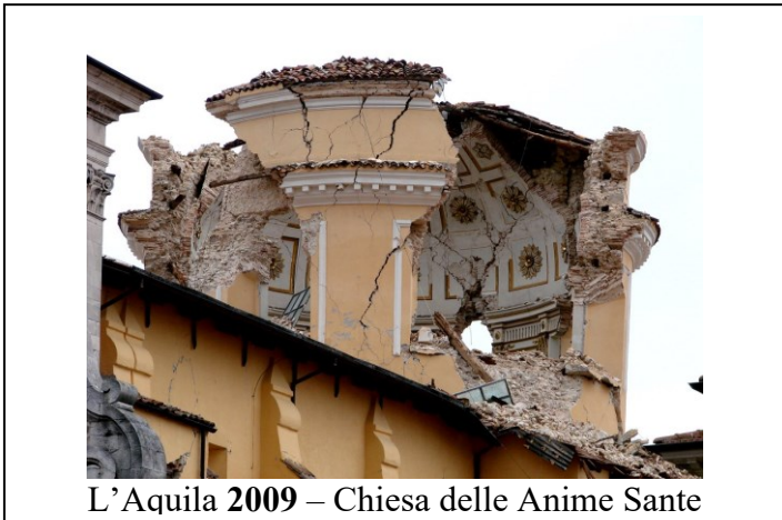
L'Aquila 2009 – Chiesa delle Anime Sante

Verranno inoltre illustrate le problematiche inerenti alla vulnerabilità idrogeologica del nostro territorio e le azioni messe in atto per affrontarle.