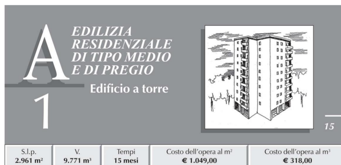
TABELLA RIASSUNTIVA DEI COSTI E PERCENTUALI D'INCIDENZA